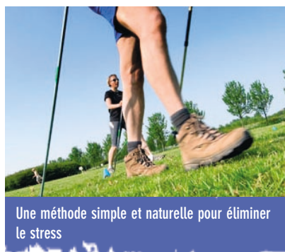
Une méthode simple et naturelle pour éliminer le stress